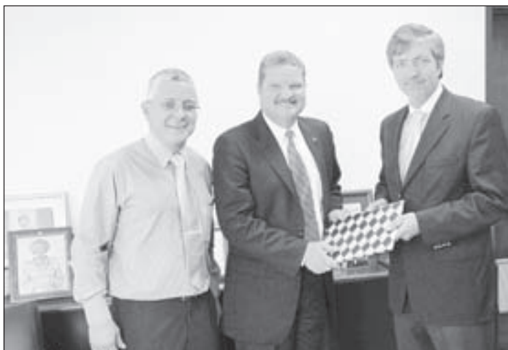
Premier Eman expresa cu Aruba ta trahando duro pa establece un imagen nobo

E bishita tabata relaciona cu e plannan pa hunto cu e compania renombra Arubiano ECA Communication Group realisa e proyecto di haci di Aruba un "Hub di Conocemento" pa Caribe. Un bishita di cortesia a ser